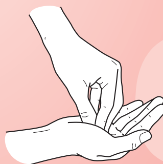
Frictionner avec rotation les bouts des doigts unis sur la paume de la main contraire et viceversa.