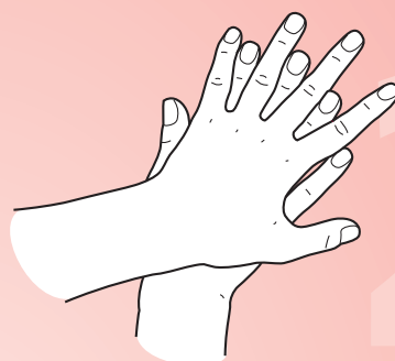
Paume de la main droite avec le dos de la main gauche et viceversa