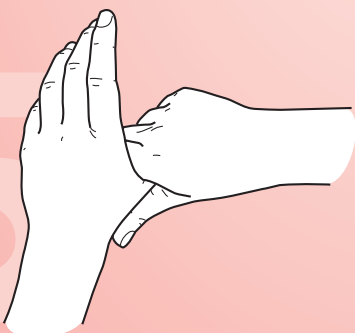
Frictionner avec rotation le pouce gauche dedans la paume droite et viceversa.