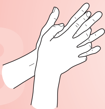
Paume contre paume avec les doigts entrecroisés.